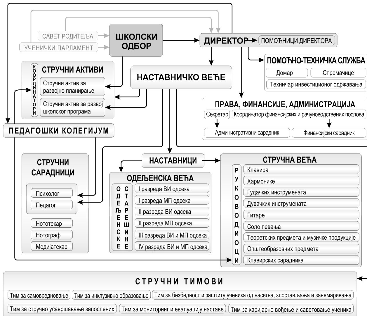
Графикон 1 – Организациона шема надређености и подређености у МШ „Коста Манојловић“

У школи су установљени одређени односи надређености и подређености који су присутни у оквиру и између појединих организационих јединица (Графикон 1).