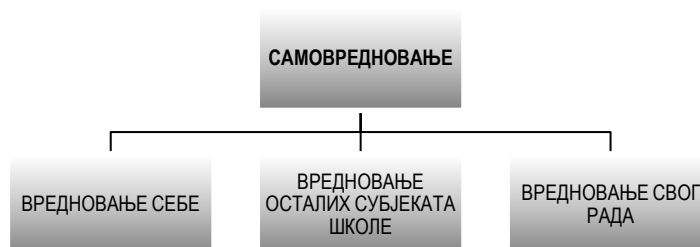
Графикон 2 – Самовредновање у школи

Самовредновање је уско повезано са развојним планом школе.